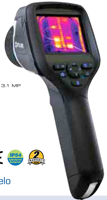
Fusión de Imágenes