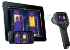
Conectividad Wi-Fi con iPad™, iPhone™, iPod™ Touch