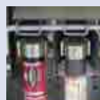
Motores: Problemas en el devanado