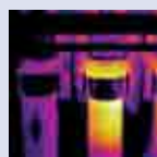
Eléctrica: Fusible sobrecalentado