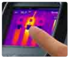
Pantalla táctil LCD de 3.5"